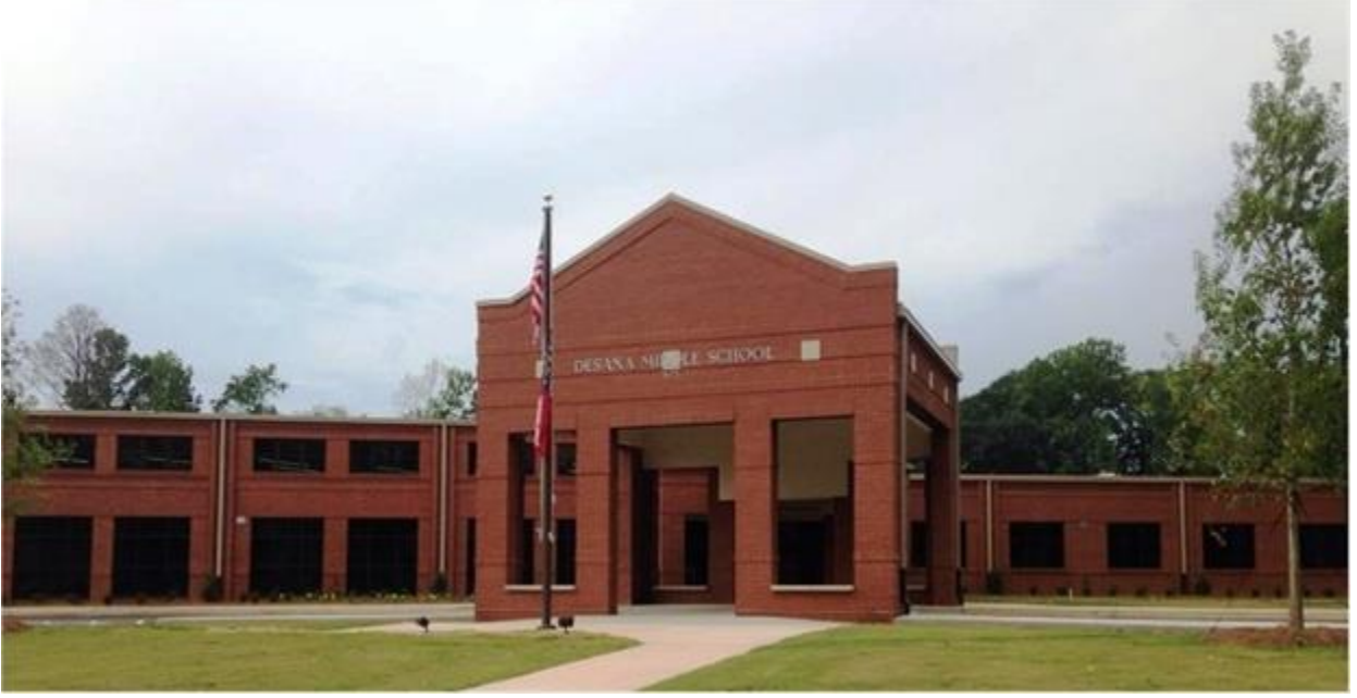
अॅटलांटा मराठी शाळा De Sana Middle School येथे भरते.